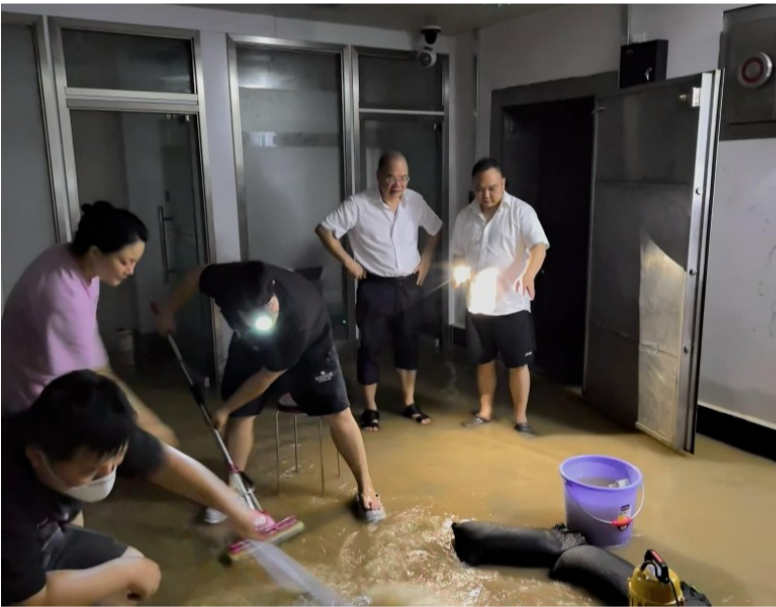
阳桥支行员工排成长队,将积水一桶一桶地排出。