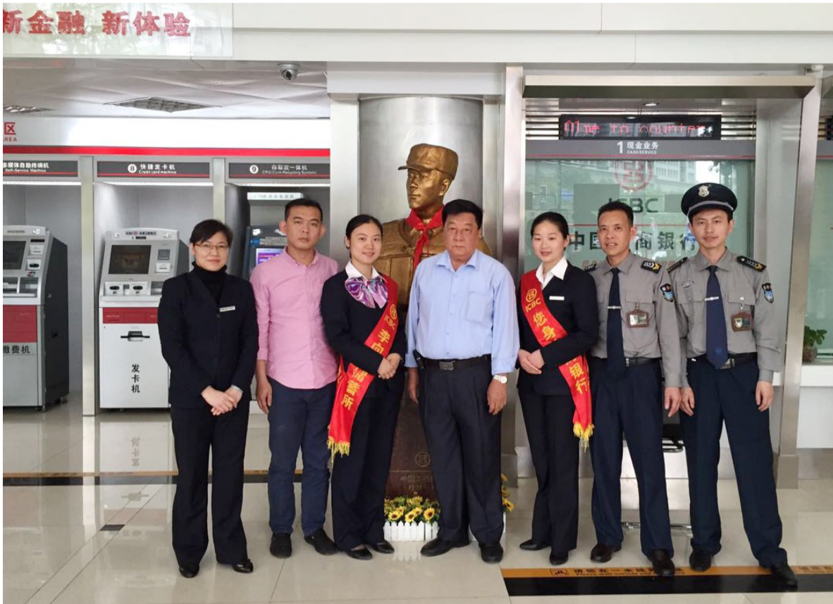
抗洪英雄李向群的父亲李德清(左四),来到阳桥支行“李向群储蓄所”看望员工,与员工一起在李向群塑像前合影留念。

1998年夏天,漓江翻滚,洪水肆虐,一个英勇的青年挺身而出,舍弃了悠闲的假期,义无反顾地返回部队、驰援灾区,参加了桂林抗洪救灾任务,并跟随部队赴湖北省荆州市抗洪抢险。