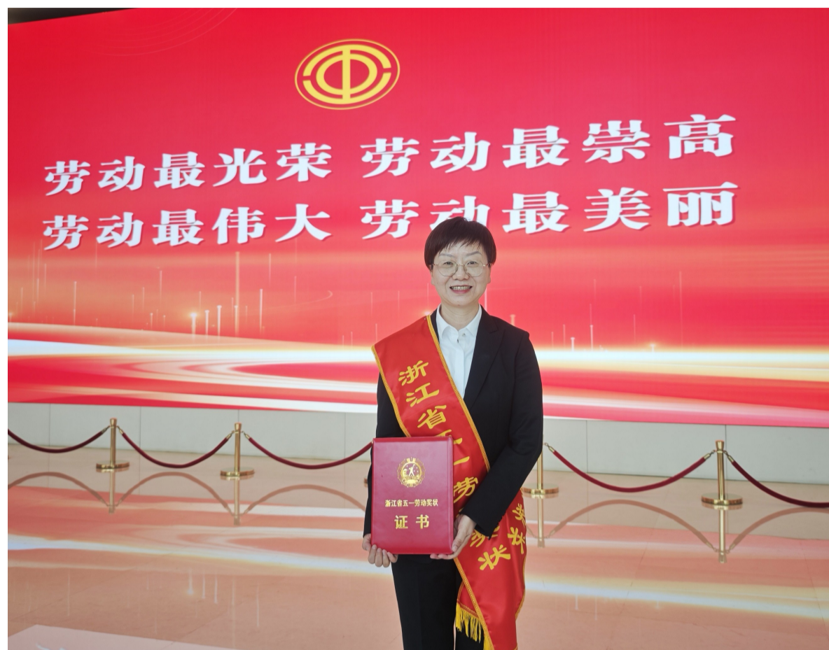
湖州分行荣获“浙江省五一劳动奖状”。

在浙江奋力推进“两个先行”的壮阔浪潮中,工商银行浙江省湖州分行以实干为笔,以担当为墨,在服务地方经济的答卷上写下浓墨重彩的篇章。近日,该行荣膺“浙江省五一劳动奖状”这一崇高荣誉,这是对全体湖州工人矢志金融报国、倾力服务浙江发展的最高褒奖,也是对该支金融铁军卓越贡献的生动诠释。