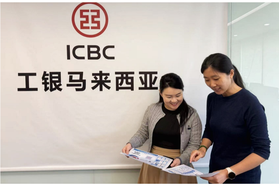
钦州分行携手工银马来西亚合作推广“汇小二”智能体。

本报讯(通讯员 黎秋萍)为进一步推进中马跨境金融服务智能化升级,搭建数字化金融合作新桥梁,近日,在国家外汇管理局钦州市分局及上级行的指导下,工商银行广西钦州分行邀约中国工商银行(马来西亚)有限公司(以下简称“工银马来西亚”)加入“汇小二”智能体的推广运用阵营。这标志着这款由广西自主研发的AI创新成果正式迈出中马跨境服务的关键一步,为两国企业与个人用户带来更智能、高效、便捷的跨境金融服务新体验。