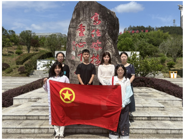
南平分行青年员工合影留念。

本报讯(通讯员 卓星宇) 近日,工商银行福建省南平分行、国家统计局南平调查队和南平市卫健委联合开展“幸福‘统’筹,健康‘卫’来,一起‘工’赢”主题团日活动,来自三家单位的40余名青年员工共同前往水吉镇仁山政绩效观基地开展政绩效观主题研学,通过文化浸润、趣味互动与金融服务宣讲,在轻松氛围中增进了解、共话发展。